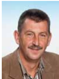
Rudolf Bernreiter (SPÖ)