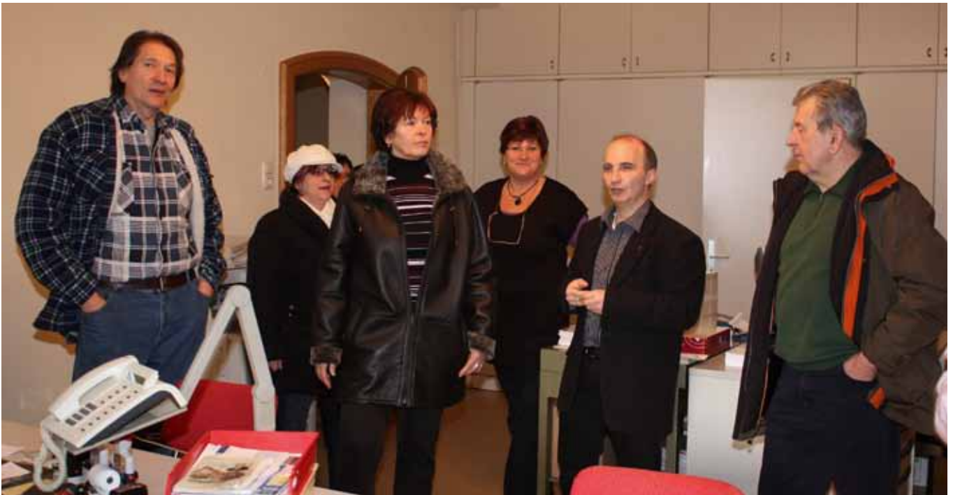
Reges Interesse zeigte die Bevölkerung beim ersten „Tag der offenen Tür“ unserer Gemeinde. Mehr als 100 Besucher kamen und staunten.