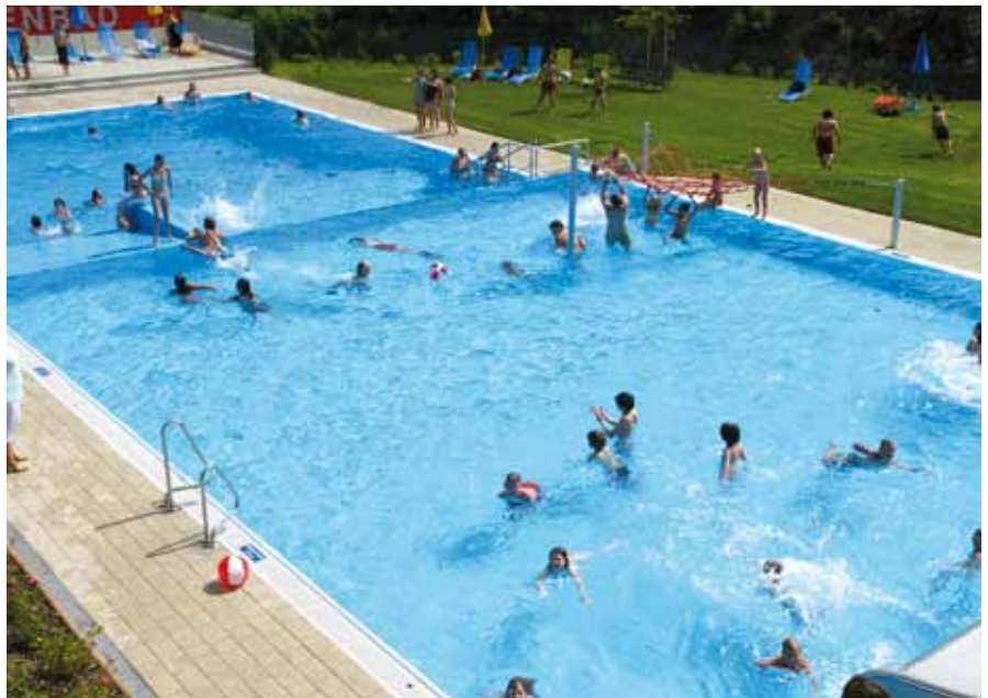
Seit heuer ist es erstmals möglich, bei der Badekasse auch Schwimmwindeln, Schwimmflügerl und Sonnencreme zu erwerben.

vom Badebuffet auf der Terrasse kein Eintritt zu bezahlen ist. Die Bademeister sowie Badekassierinnen sind jedoch angewiesen auch dann Eintritt zu verlangen, wenn nur die Liegewiese genutzt wird. Ich ersuche diesbezüglich um Ihr Verständnis.