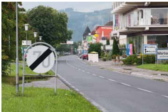
Ist es bald zu Ende mit 70 im Bereich Krummnußbaum – Marbach?

zung betreffend die notwendigen Umbauarbeiten kann im Gemeinderat darüber beraten werden.