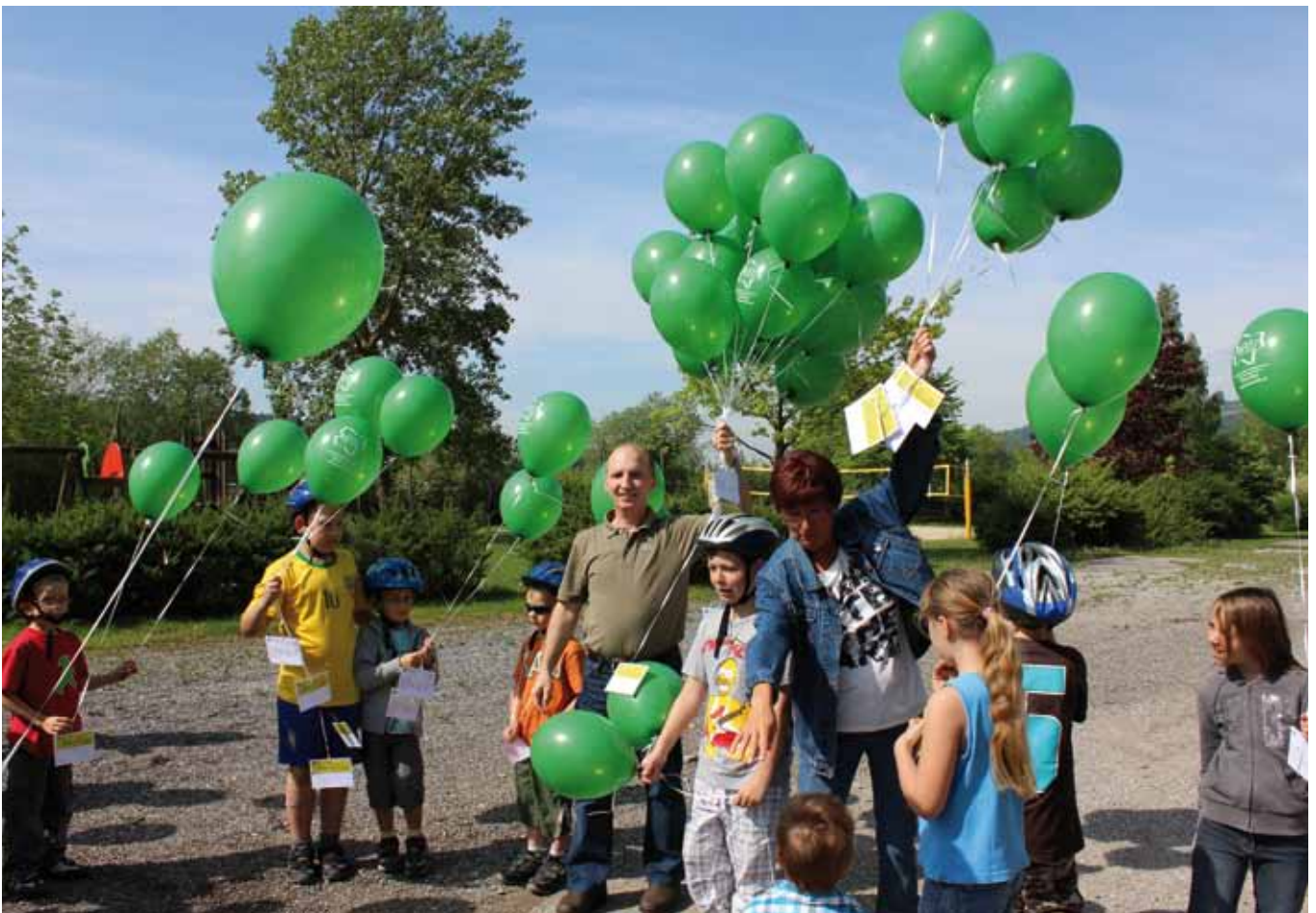
Einen tollen Erfolg landeten die Organisatoren des „Donau-Bike-Events“.