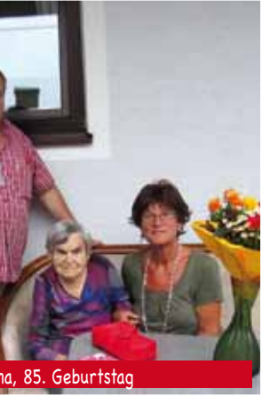
na, 85. Geburtstag