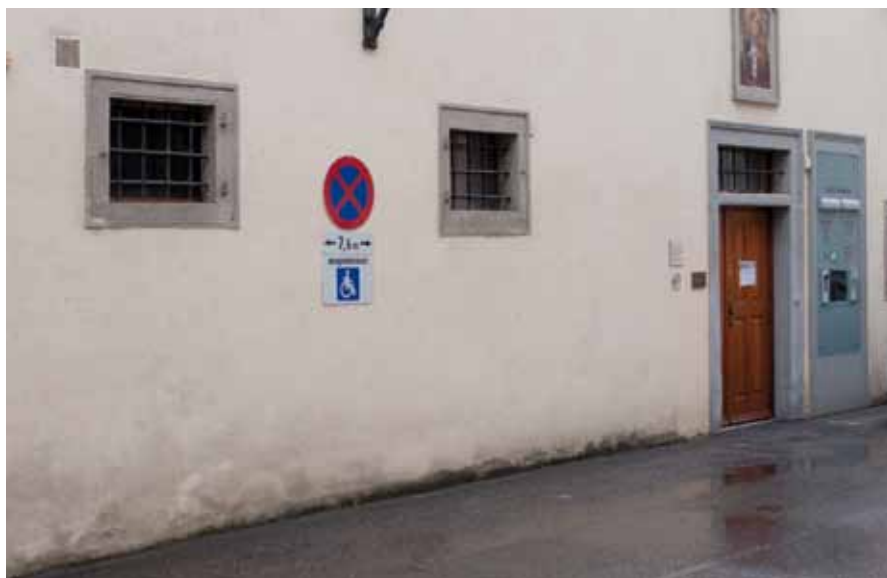
Eine wichtige Änderung für gehbehinderte Menschen: der neue Behindertenparkplatz vor der Ordination unserer Gemeindeärztin.

sen. Nachdem immer wieder auch Fahrzeuge ohne dementsprechenden Ausweis auf dieser Parkfläche parken, möchte ich darauf hinweisen, dass dies strafbar ist und von der Polizei auch dementsprechend kontrolliert wird.